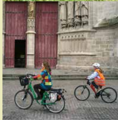
Amiens : La cathédrale

En savoir + www.somme-tourisme.com www.vallee-somme.com www.somme14-18.com