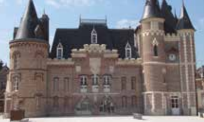
Hôtel de ville de Corbie