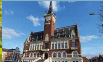
Hôtel de ville d'Albert