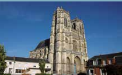
Abbatale de Corbie