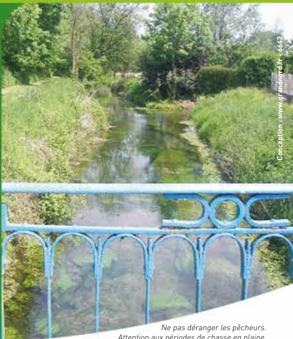
Ne pas déranger les pêcheurs. Attention aux périodes de chasse en plaine.

En venant d'Albert, prendre la RD 50 jusqu'à Miraumont puis la D163.